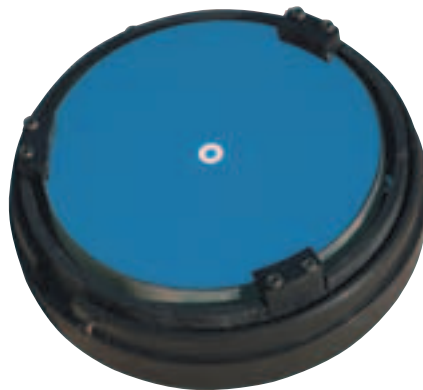
Un œillet positionné précisément au centre du miroir primaire facilite l'alignement des optiques. Situé dans l'"ombre" du miroir secondaire, il est sans conséquence pour les images.

↳ Le concept de monture Dobson vise deux objectifs : la simplicité et un coût de fabrication minime. Celle du Star Blast, en bois, remplit ce contrat tout en offrant à l'instrument une bonne stabilité. De prime abord, le fait que le télescope soit soutenu par une seule branche laisse planer quelques doutes sur l'équilibre de l'ensemble.