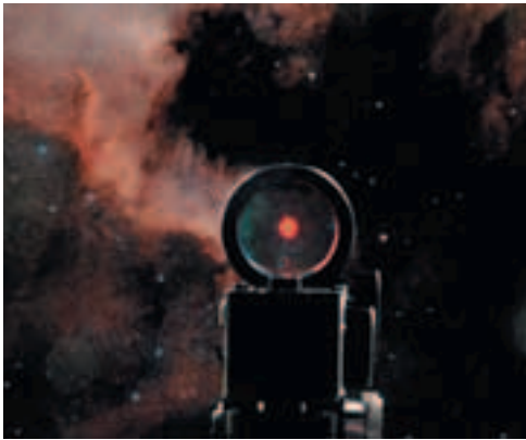
Le chercheur fait partie de la famille des "pointeurs rouges". Un point lumineux se réfléchissant sur une lame en verre assure une grande facilité de pointage.

le défaut est d'augmenter la diffusion lumineuse autour des astres), mais des lames en aluminium assez fines.